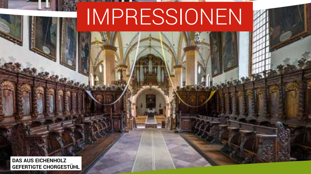
DAS AUS EICHENHOLZ GEFERTIGTE CHORGESTÜHL