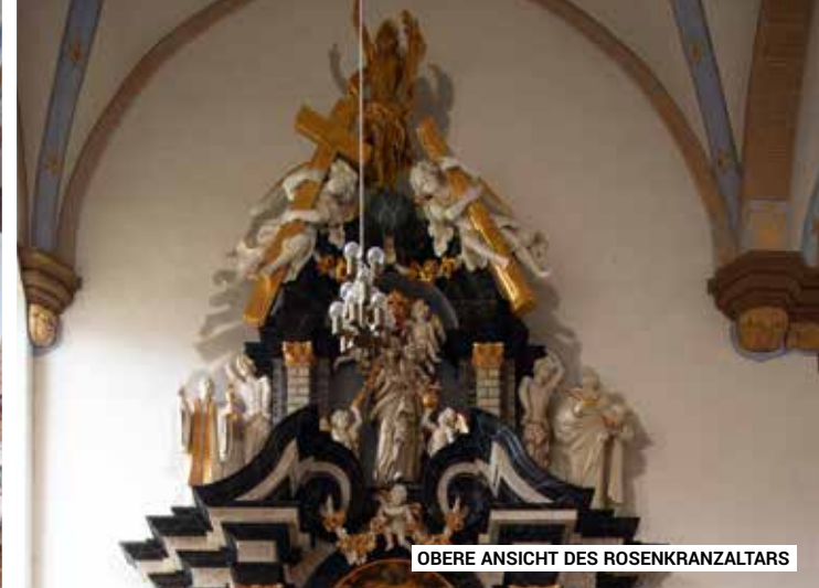
OBERE ANSICHT DES ROSENKRANZALTARS