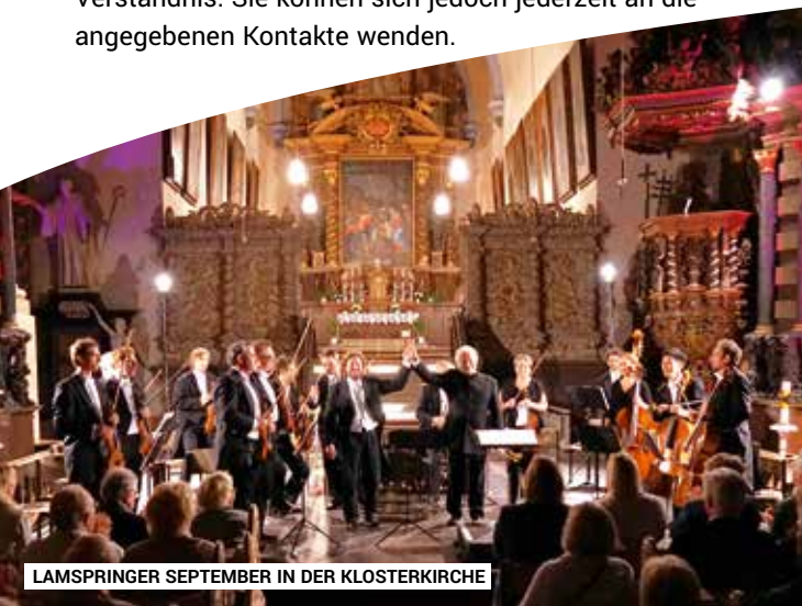
LAMSPRINGER SEPTEMBER IN DER KLOSTERKIRCHE

Die Kirche kann wegen einiger Diebstähle und mutwilligen Zerstörungen in der Vergangenheit nicht unbeaufsichtigt geöffnet bleiben. Wir bitten Sie um Verständnis. Sie können sich jedoch jederzeit an die angegebenen Kontakte wenden.