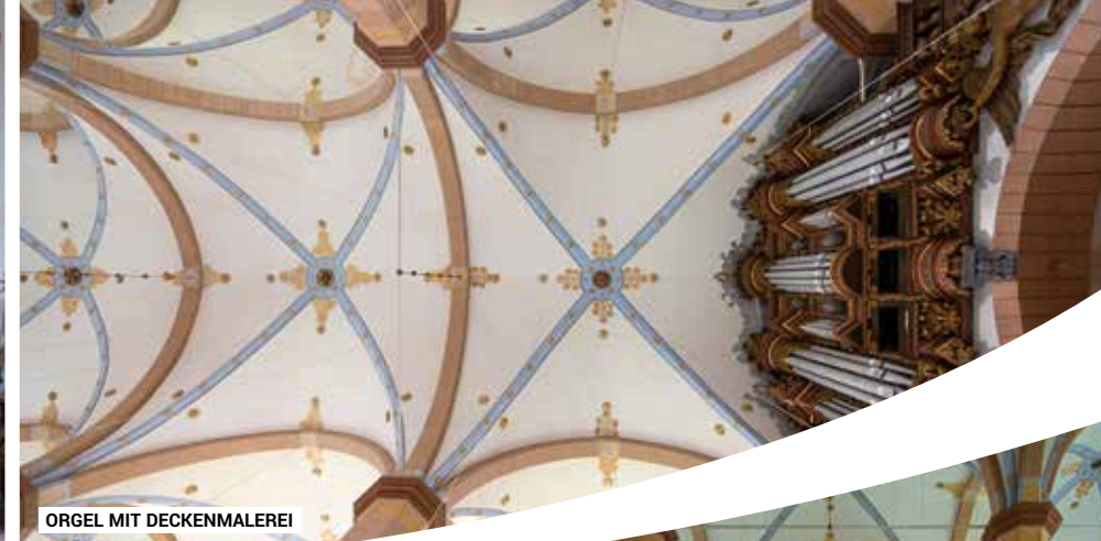
ORGEL MIT DECKENMALEREI