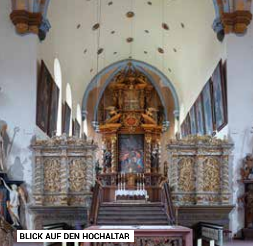
BLICK AUF DEN HOCHALTAR

Überzeugen Sie sich bei einem Besuch persönlich von unserer einmalig schönen Klosterkirche!