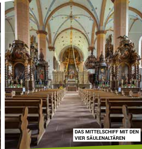
DAS MITTELSCHIFF MIT DEN VIER SÄULENALTÄREN