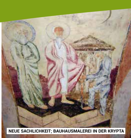
NEUE SACHLICHKEIT; BAUHAUSMALEREI IN DER KRYPTA