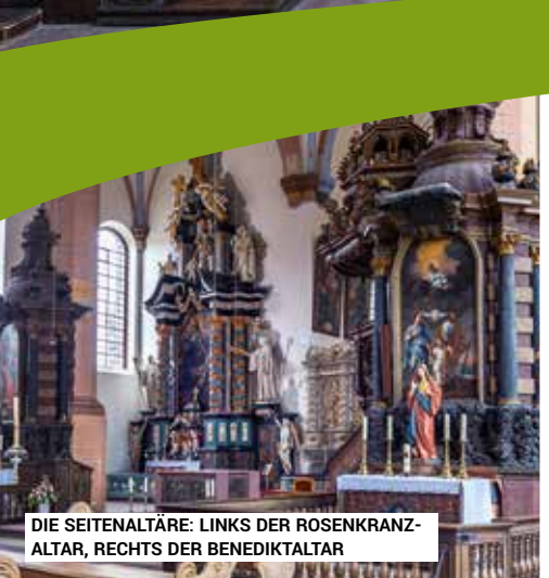
DIE SEITENALTÄRE: LINKS DER ROSENKRANZALTAR, RECHTS DER BENEDIKTALTAR